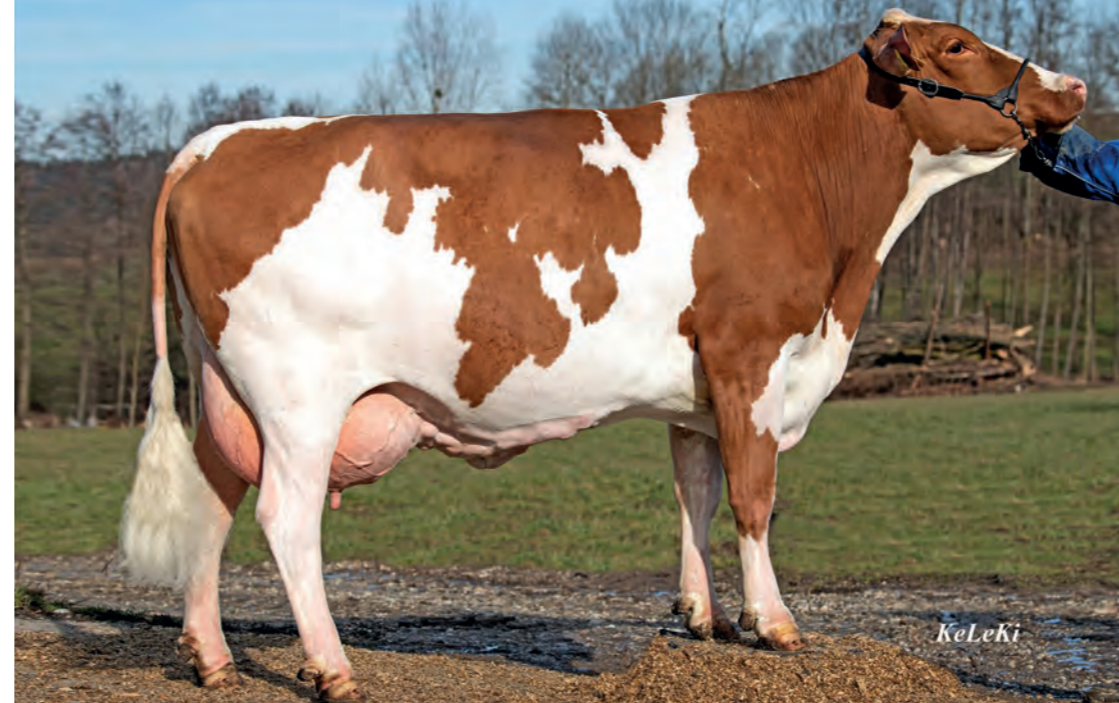
Die Mutter: Hurlys-Tochter Sidney